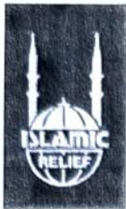
Islamic Relief Albania