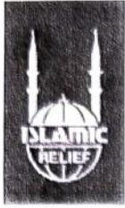
Islamic Relief Albania